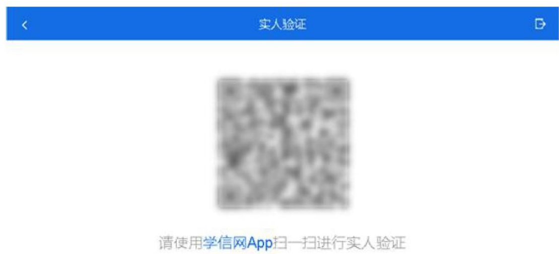
附图 4：电脑端实人验证扫码界面